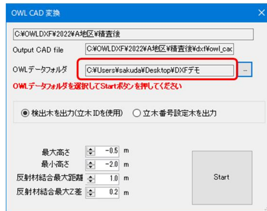
ライン出力のための地面からの高さ範囲の設定

OWLManager : 主画面 (右側上部 : 2次元位置図) (右側下部 : 全立木リスト) → 全立木リスト.csv (出力)